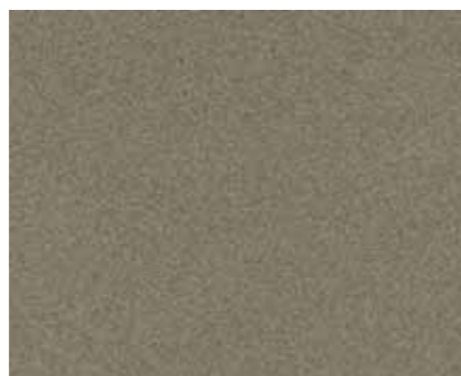
Carbon Bronze Pearl