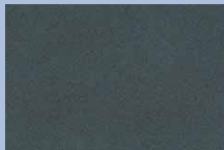
Sparkle Gray Pearl