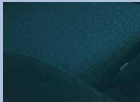
Grå-svart stofftrekk (1,7 Comfort)