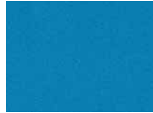
Vivid Blue Pearl