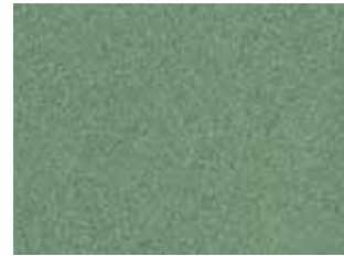
Galapagos Green Metallic