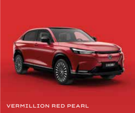
VERMILLION RED PEARL