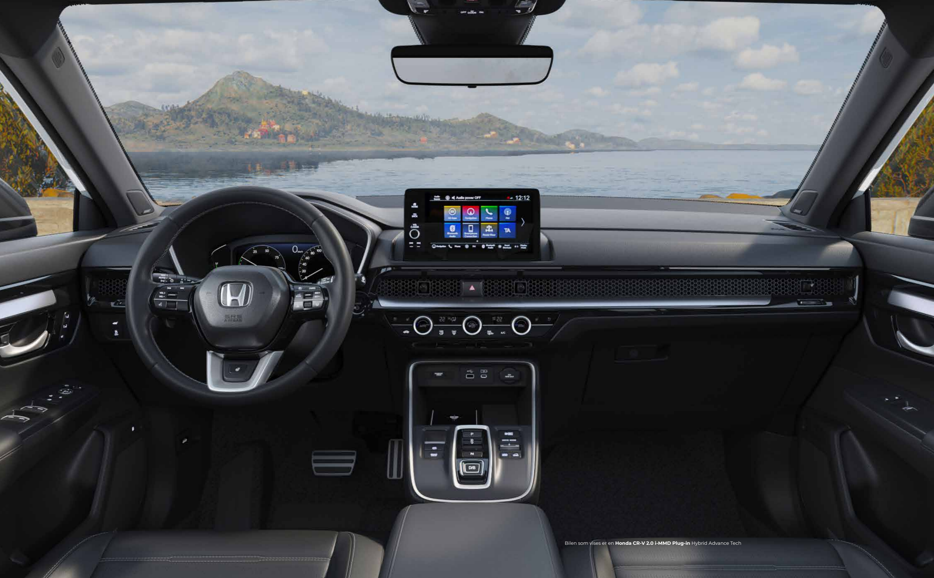
Bilen som vises er en Honda CR-V 2.0 i-MMD Plug-in Hybrid Advance Tech