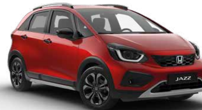
Premium Crystal Red Metallic

Vi har skapt et bredt spekter av farger som passer perfekt til den nye, stilige Jazz Crosstar, og som suppleres med vårt utvalg av setetrekk av høy kvalitet.