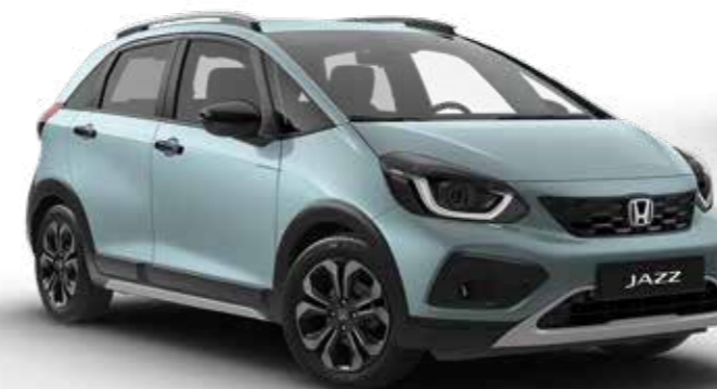
Fjord Mist Pearl