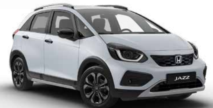
Premium Sunlight White Pearl