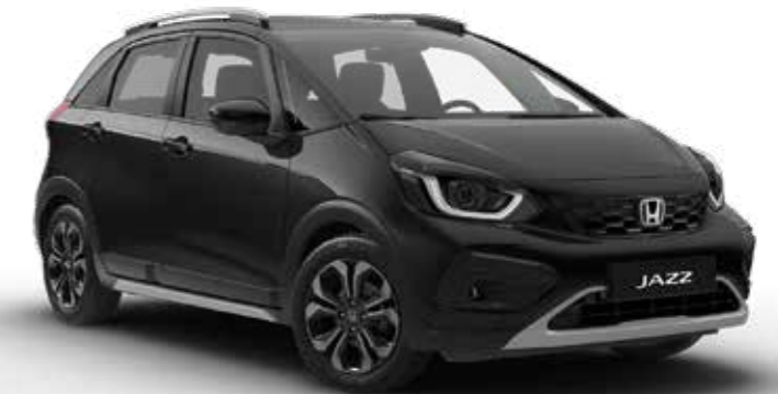
Crystal Black Pearl