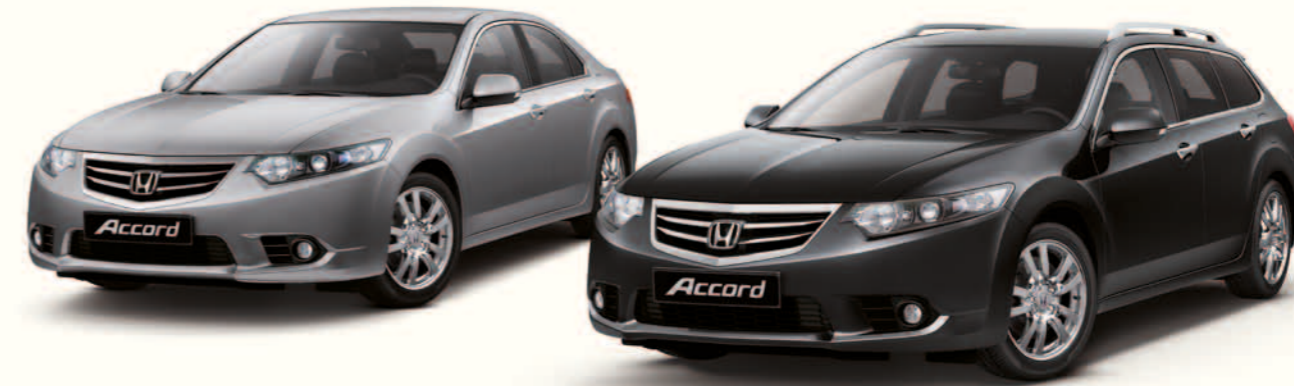
Bilene på bildet er Sedan og Tourer 2.0 i-VTEC Elegance