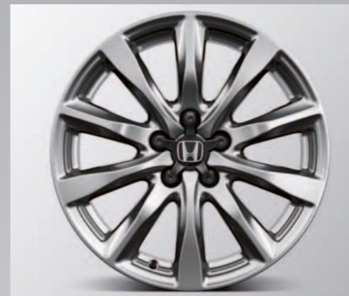
> 18" Flash lettmetallfelg *