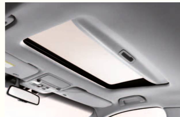
> Elektrisk soltak