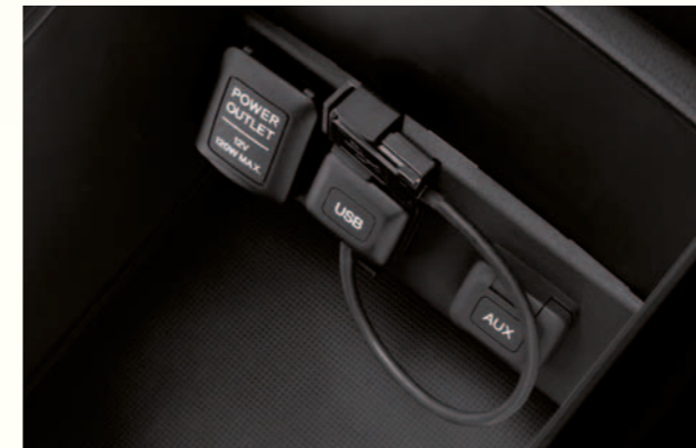
USB og tilbehørsuttak