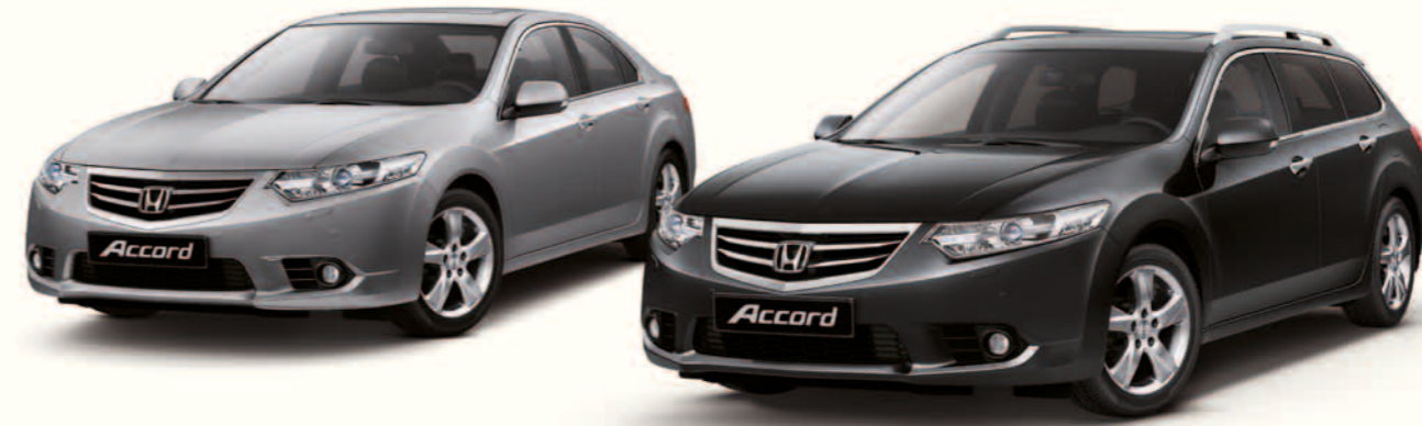
Bilene på bildet er en Sedan og Tourer 2.0 i-VTEC Executive

(Hør med din lokale forhandler om tilgjengelighet)