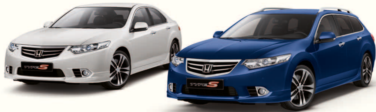
Bilene på bildet er Sedan og Tourer 2.4 i-VTEC Type S