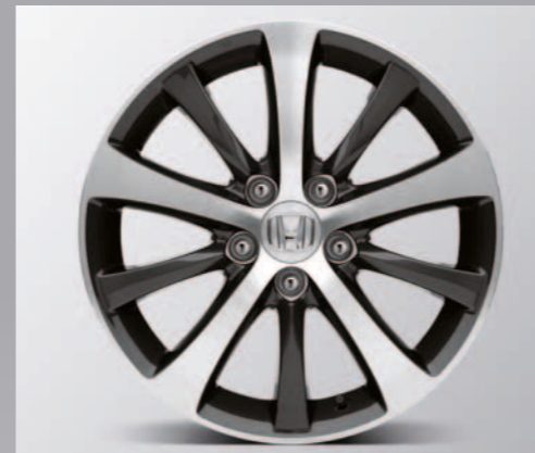
> 17" Quartz lettmetallfelg

* Kan leveres på forespørsel. Leveringstid kan forekomme