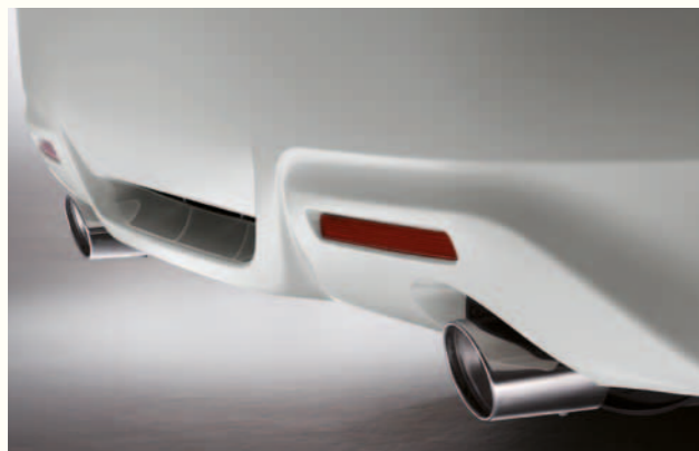
> Doble eksosrør