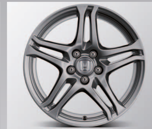
> 18" Thunder lettmetallfelg