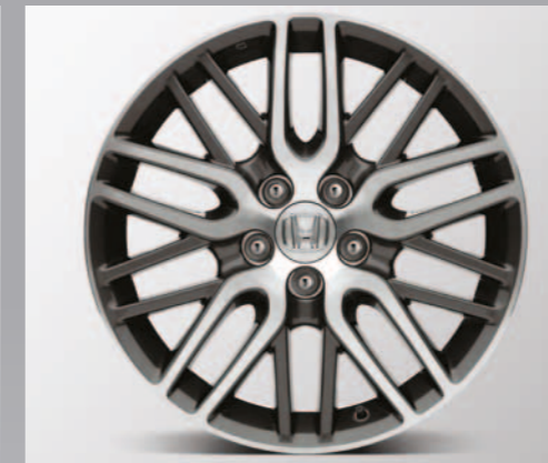
> 18" Delta lettmetallfelg