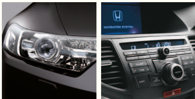
> Bi-HID Lyskastere