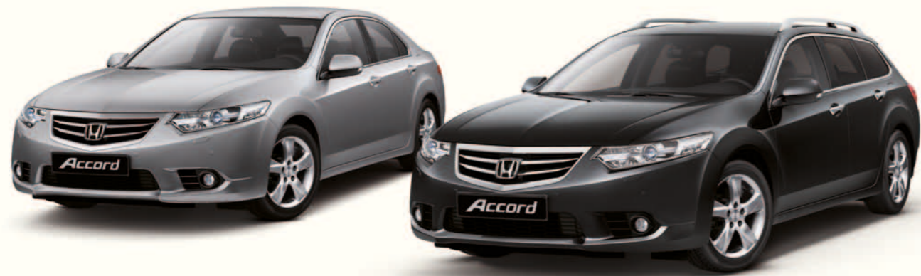
Bilene på bildet er Sedan og Tourer 2.0 i-VTEC Lifestyle