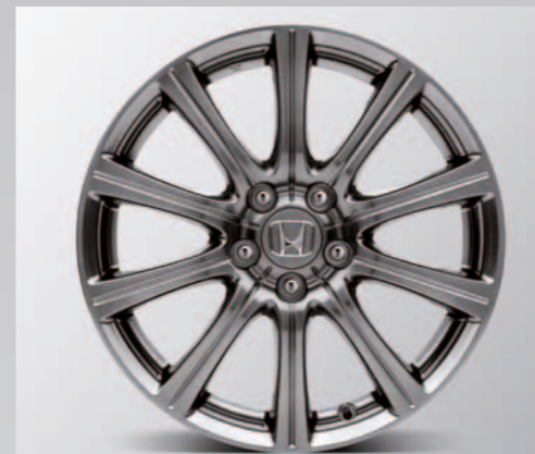
> 18" Sigma lettmetallfelg