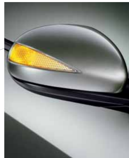
Innfellbare utvendige speil En annen svært stilren formgivningsdetalj. De innfellbare utvendige speilene har innebygde blinklys med en unik trekantet form. Og jo lengre blinklys, desto lettere er det for andre trafikanter å se dem.