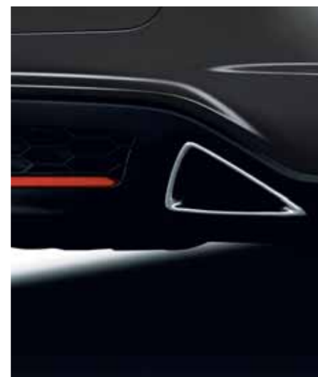
Eksosrør Forkrommede eksosrør som gjenspeiler triangeltemaet til Civic er spennende både konsept- og funksjonsmessig.