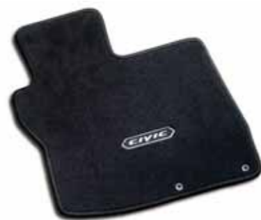
Gulvmatter gir både ekstra beskyttelse og eleganse i kupéen