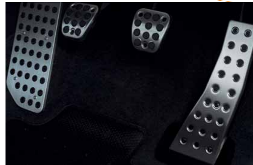
Aluminiumspedaler Pedalene og fotplaten har en spennende futuristisk stil, helt i tråd med det overgripende konseptet for Civic.

Kupéen i Civic har fått like mye oppmerksomhet som dens eksteriør. Alt er av aller nyeste design, og alt fungerer med 100 % effektivitet.