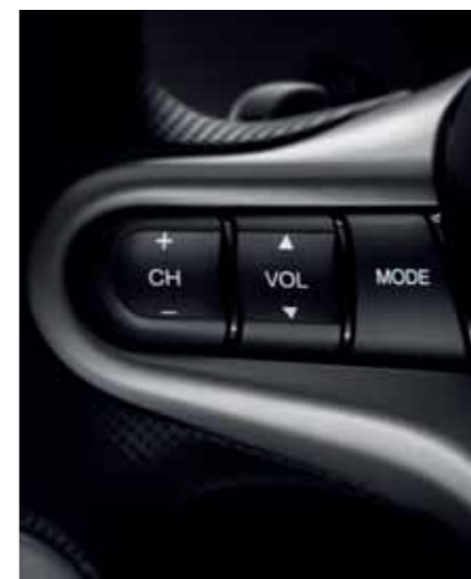
Lydkontroll Lydkontrollene er plassert på den venstre ratteiken. Du behøver aldri ta blikket fra veien for å finne dem.