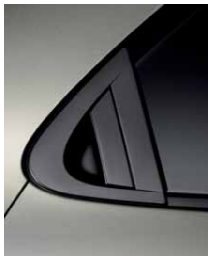
Bakre dørhåndtak Innfelt, i flukt med bakstolpene, sitter de diskrete dørhåndtakene som gir et aerodynamisk 3-dørs inntrykk med 5-dørs funksjonalitet.