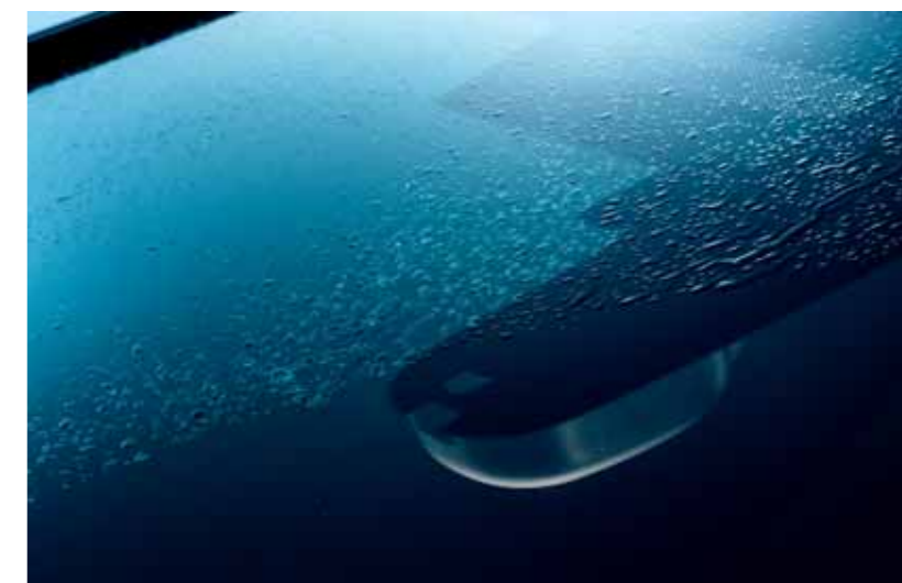
Automatiske vinduspussere Når de første dråpene faller på frontruten, starter vinduspusserne automatisk. Deretter er kontrollen din.