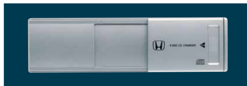
CD-skifter med plass til inntil 8 av dine favorittplater