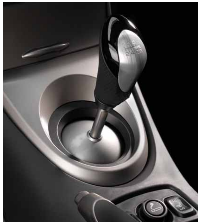
Girspakknapp i sporty perforert lær og aluminium for både manuelle og automatiske girkasser.