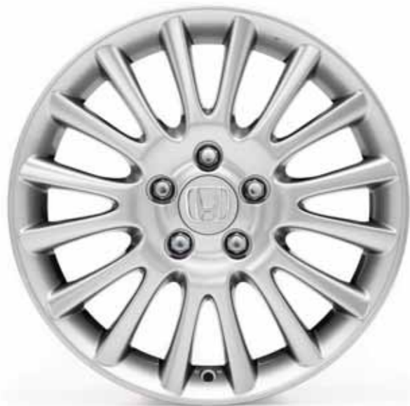
17-tommers lettmetallfelger med imponerende 16 eiker

Hvis du vil sette sammen en egen tilbehørspakke, er utvalget stort til din nye Civic. For mer tilbehør, se brosjyren "Honda Civic 5d tilbehør" eller besøk www.honda.no