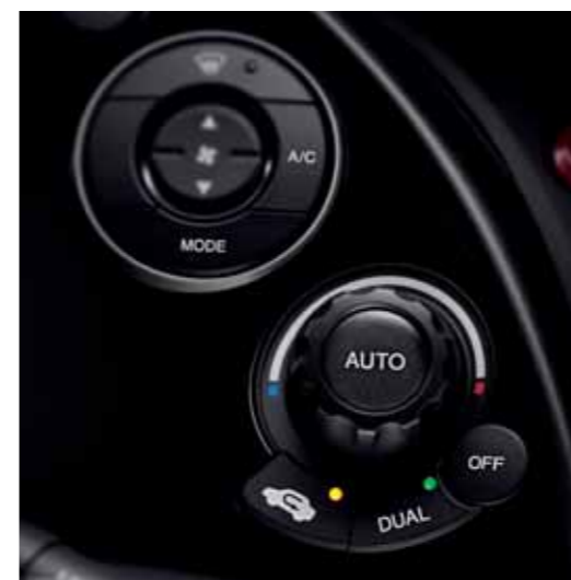
Klimakontroll Varmt eller kaldt på et øyeblikk. Med klimaanlegget kan førerens og passasjerens miljø stilles inn uavhengig av hverandre. (Kun Executive)