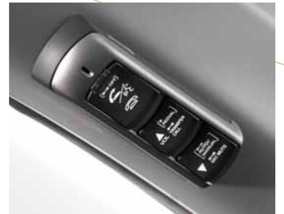
Bluetooth® systemet – den mest innovative handsfreløsningen for din telefon.