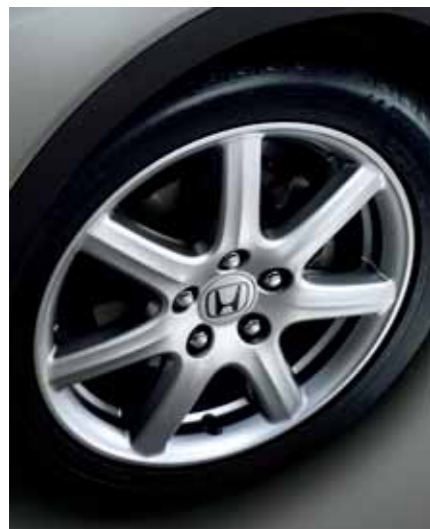
17-tommers lettmetallfelger 17-tommers aluminiumsfelger med sju eiker forbedrer både utseendet og veigrepet. (Ikke Comfort)

Det nye i Civic handler ikke bare om de store linjene, som en fantastisk formgivning og aerodynamikk. Det handler også om de små detaljene. I hvert henseende er den enkelte detalj utviklet for å både være estetisk tiltalende og ha en praktisk hensikt.