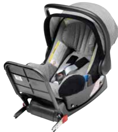
ISOFix barnesete fra 0 til 13 kg (0-15 måneder) med ISOFix-feste