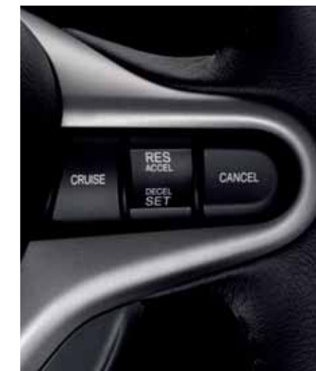
Cruise control På den høyre ratteiken kan cruisekontrollen stilles inn med en finger uten at du behøver å slippe rattet.