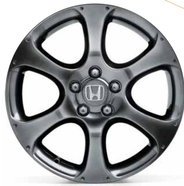
18-tommers lettmetallfelger, 6-eikers utførelse i mørkegrått. (Kun til modeller med 17-tommers lettmetallfelger originalt.)