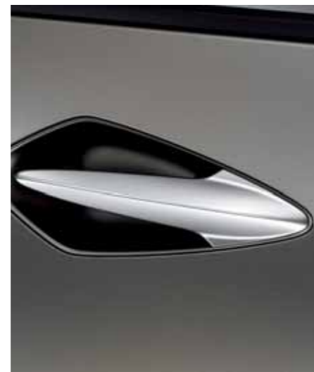
Dørhåndtak foran Innfelte, trekantede og sikrere enn utstikkende håndtak.