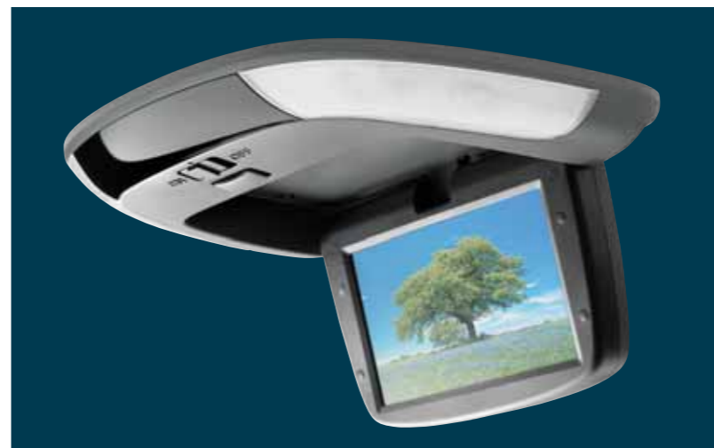
i-VES underholdningssystem med skjerm og studiolyd i bilen, CD- og MP3-kompatibelt med medfølgende hodetelefoner.