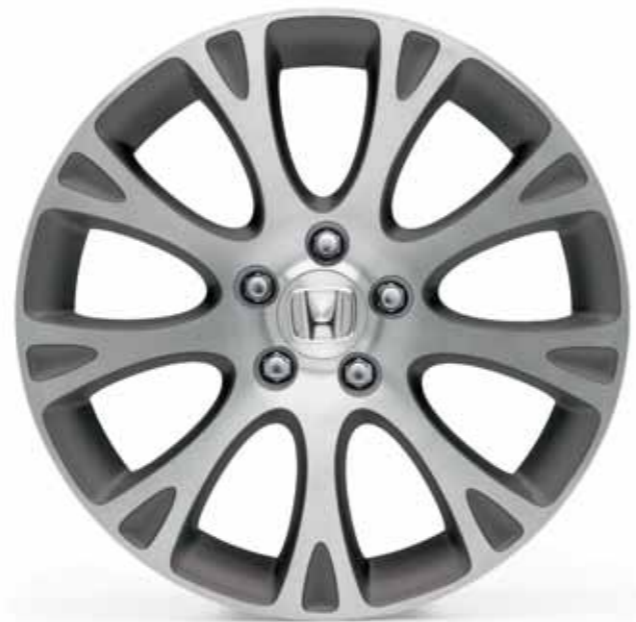
18-tommers lettmetallfelger med moderne 9-eikersstil. (Kun til modeller med 17-tommers lettmetallfelger originalt.)