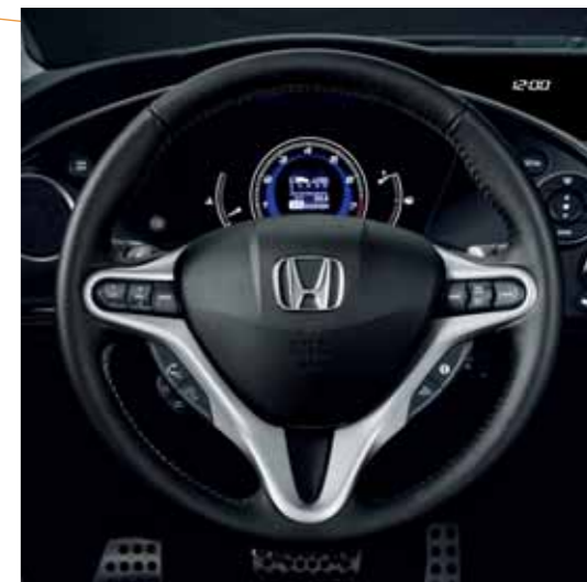
Skintrukket ratt Det lekne rattet med 3 eiker er ingen hindring for all viktig informasjon i instrumentpanelet som du har i det ytre synsfeltet ditt. Du behøver aldri å slippe veien med øynene.