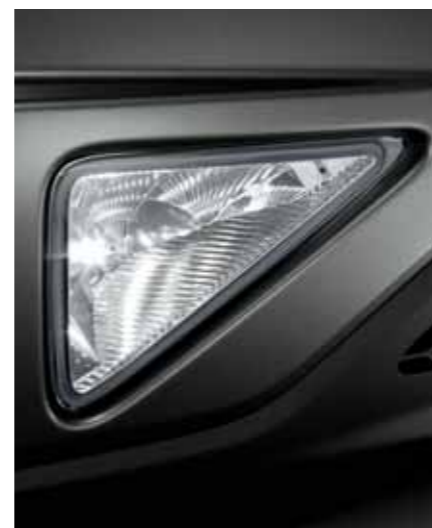
Tåkelys foran I den fremre stoffangeren er det tåkelys som både har trekantet form og er svært kraftige.

Kupéen i Civic har fått like mye oppmerksomhet som dens eksteriør. Alt er av aller nyeste design, og alt fungerer med 100 % effektivitet.