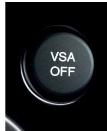
VSA Stabiliseringsystemet VSA hjelper til å holde kursen i svinger, ved akselerasjon og unnamanøvrer.