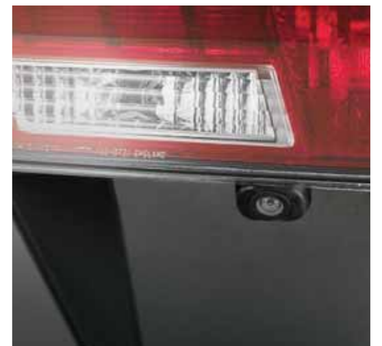
Et bakre kamera viser bilder på navigasjonsskjermen slik at du alltid vet hva som er bak deg. (Fungerer kun på modeller med fabrikkmontert navigasjonsskjerm.)