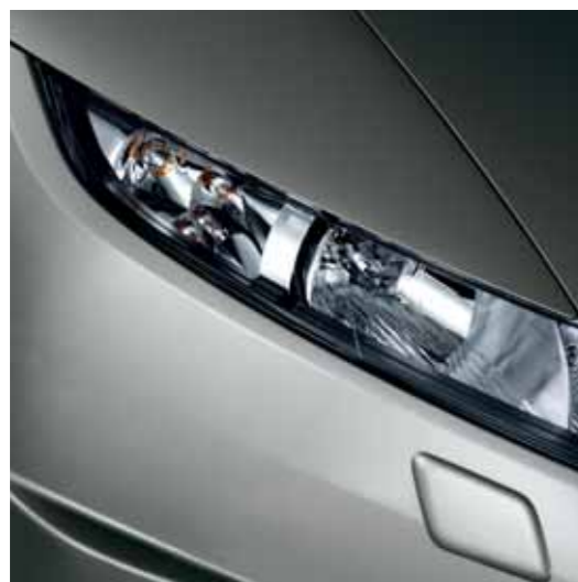
Lyskasterhus foran Lange og vinklede. De gjenspeiler designidéen og glir nøye inn i panserets linjer for å forbedre aerodynamikken.