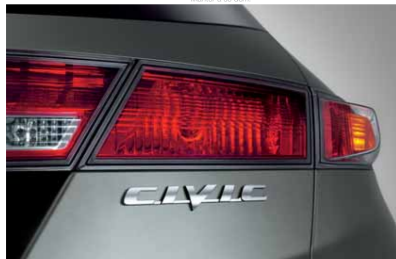
Lykتهus bak Lange og smale bakre lykتهus matcher karosseriformen og sprer lyset bedre.